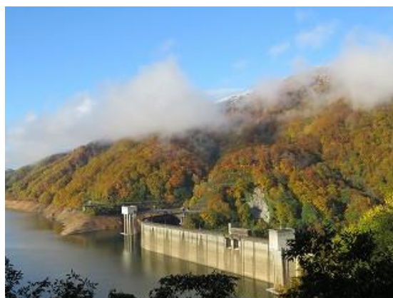
小見線より有峰ダムを眺望（10/25 撮影）