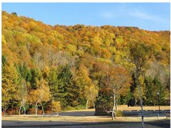
自由広場より猪根山を眺望（10/27 撮影）