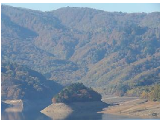
小見線より宝来島を眺望 山頂の雪は消雪（10/26 撮影）