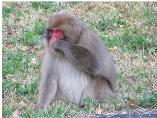
シロツメクサ捕食中のニホンザル

10月27日（火）夕方3:30頃自由広場にニホンザルの群れが出ました。ロゼット状態になったシロツメクサやアカツメクサの葉や茎を捕食していました。週末自由広場を散策する訪問者が多かったせいか不思議なことにニホンザルの出没はありませんでした。自由広場に人がいなくなったタイミングを計って出没しているかのようです。