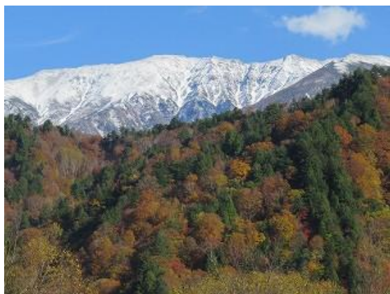
旧有峰ハウス前広場より冠雪の薬師岳を眺望 (10/27 14:00 撮影)