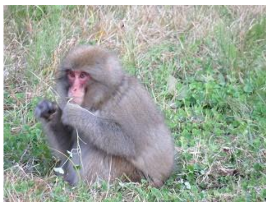
シロツメクサ捕食中のニホンザル