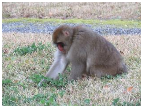
シロツメクサ捕食中のニホンザル