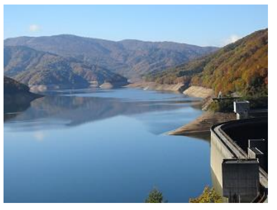
有峰ダム展望台より有峰湖を眺望（10/26 撮影）