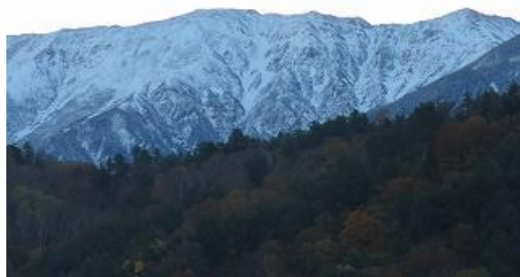
旧有峰ハウス前広場より冠雪の薬師岳を眺望 (10/27 6:30 撮影)