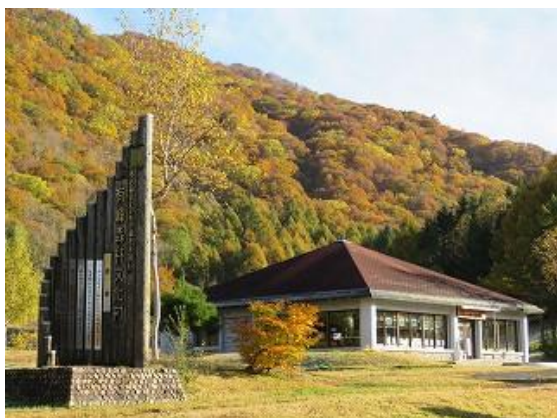
ビジターセンター前から猪根山を眺望（10/27 撮影）