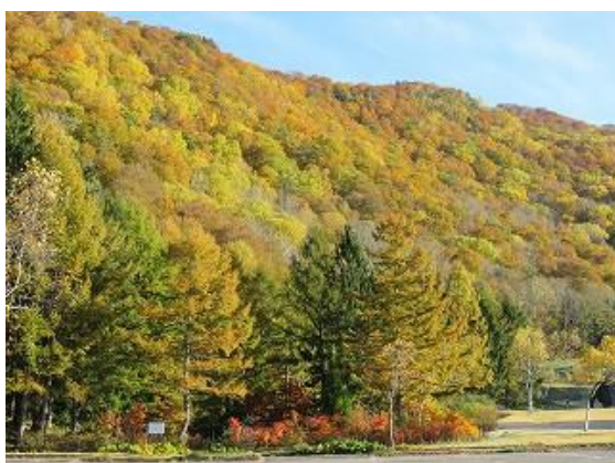
自由広場より猪根山を眺望（10/27 撮影）