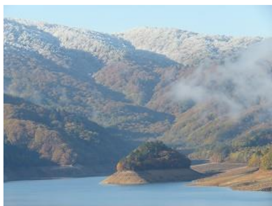
小見線より有峰湖と宝来島を眺望（10/25 撮影）