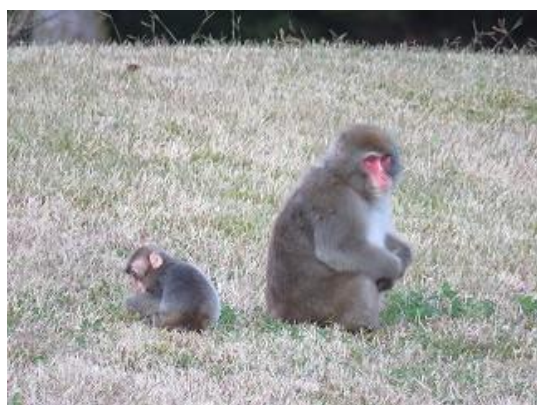
シロツメクサ捕食中のニホンザル