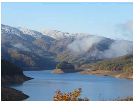
有峰湖展望園地より有峰湖と宝来島を眺望 山の頂上が雪化粧（10/25 撮影）