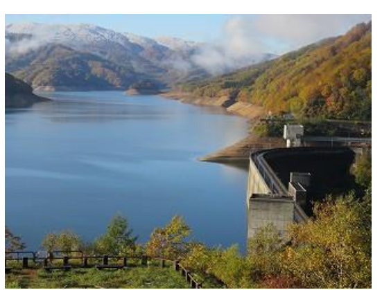
有峰ダム展望台より有峰湖を眺望（10/25 撮影）