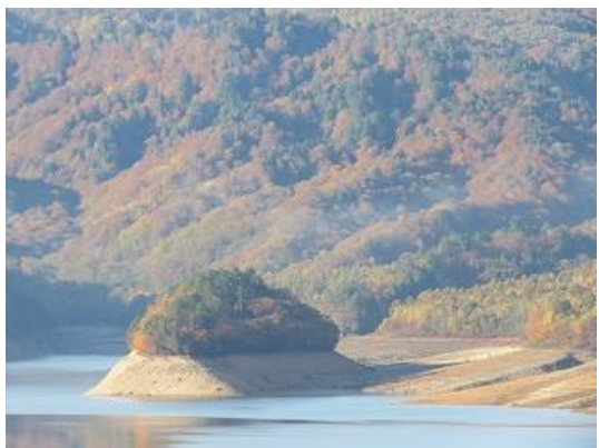
小見線より宝来島を眺望（10/27 撮影）