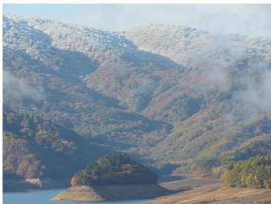
小見線より宝来島を眺望 山頂が雪化粧（10/25 撮影）