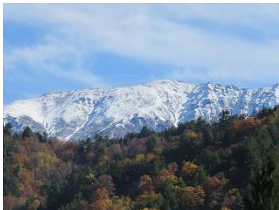
旧有峰ハウス前広場より冠雪の薬師岳を眺望 (10/27 11:00 撮影)