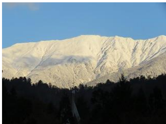
2回目の冠雪により純白の山容を見せる薬師岳 (10/25 夕方 4:40 頃撮影)