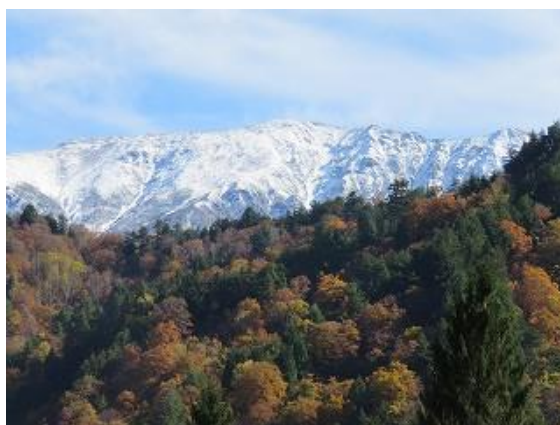
旧有峰ハウス前広場より冠雪の薬師岳を眺望 (10/27 11:10 撮影)