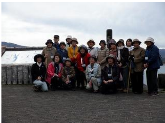
「有峰湖展望台」で記念撮影