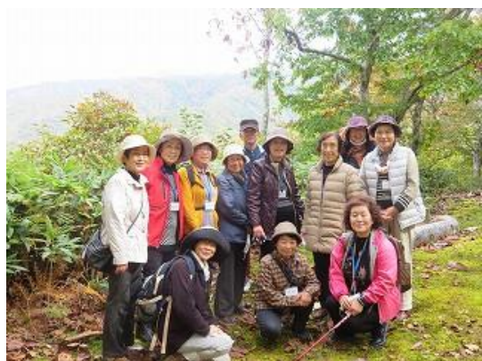
東西半島遊歩道展望台にて記念撮影