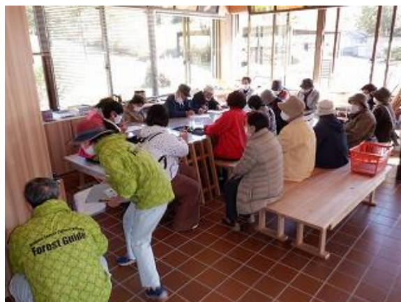
アンケート記載中の参加者