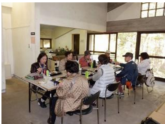
冷タ谷キャンプ場ロッジ内で昼食中の参加者