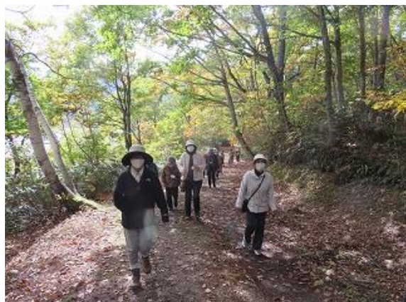
東西半島遊歩道散策中の参加者