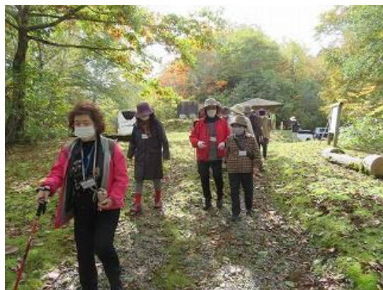
東西半島の散策に向かう参加者