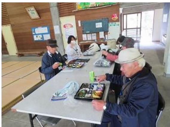
冷タ谷キャンプ場ロッジ内で昼食中の参加者