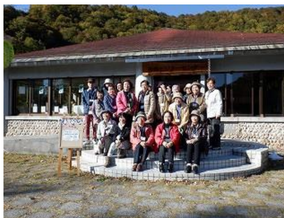
ビジターセンター前で記念撮影