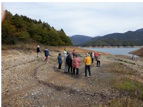
陸続きとなった宝来島周辺の散策に向かう参加者