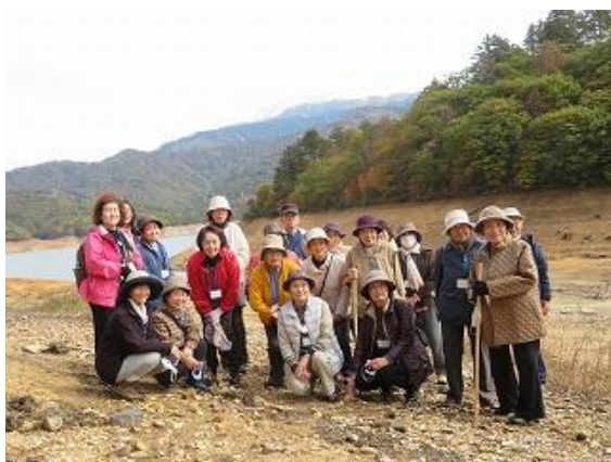
宝来島対岸で記念撮影