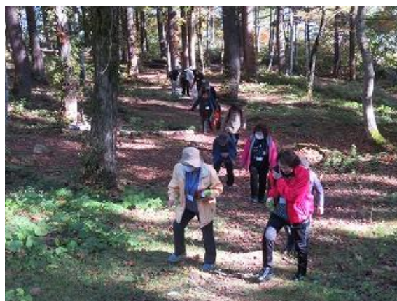
冷タ谷キャンプ場散策中の参加者