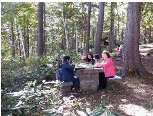
冷タ谷キャンプ場のベンチで昼食中の参加者