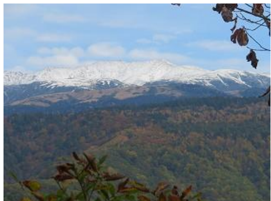
東西半島遊歩道展望台より初冠雪の薬師岳を眺望