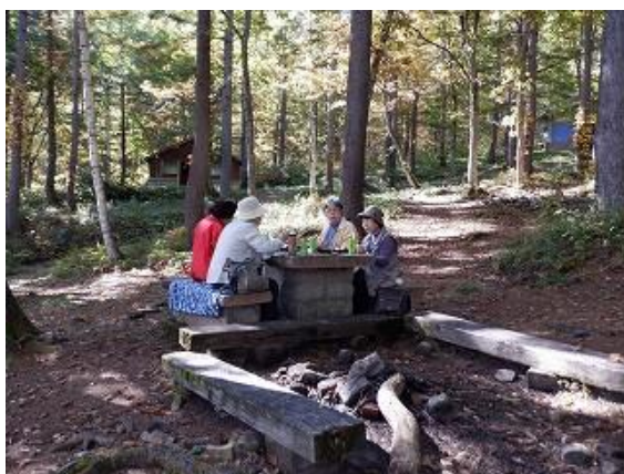
冷タ谷キャンプ場のベンチで昼食中の参加者