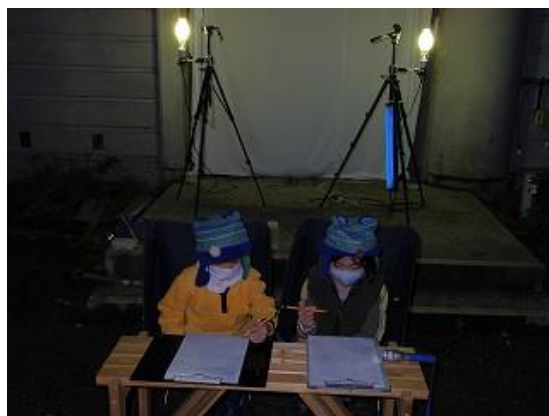
飛来した昆虫類を観察ノートに記載中のお子様