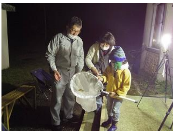
採集したヒメヤママユを観察する参加者