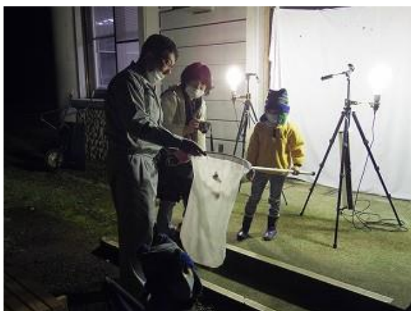
飛来したヒメヤママユをネットインした様子