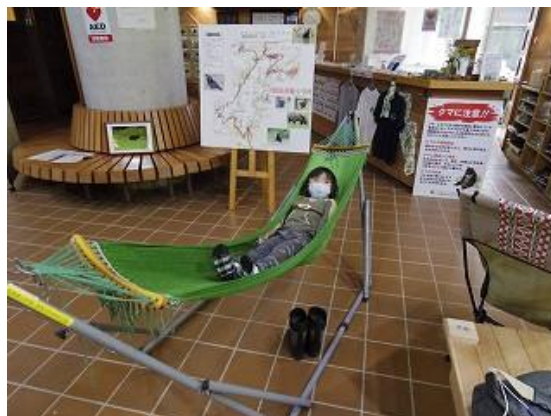
ビジターセンター内でハンモック体験するお子様