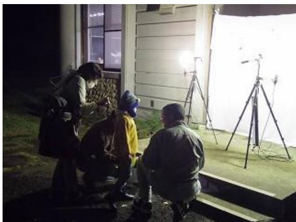
飛来した昆虫類を観察中の参加者