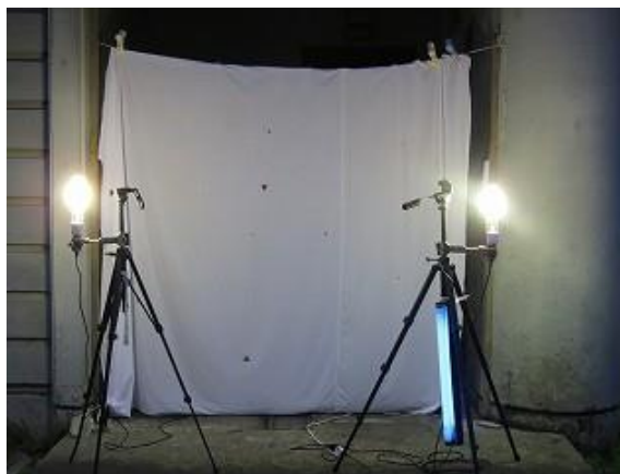
ライトトラップ開始時の様子