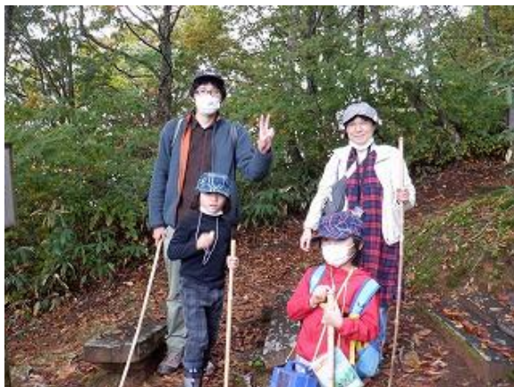
第二展望台でご家族で記念撮影