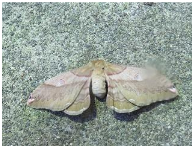
飛来したクスサン♀