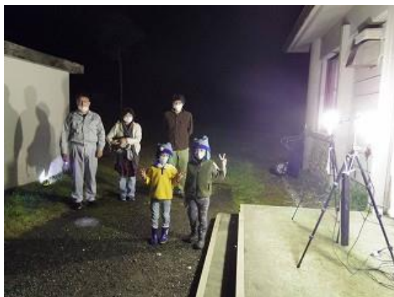
ライトトラップを前に参加者全員で記念撮影