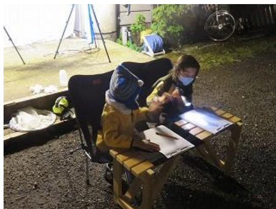
飛来した昆虫類について確認するお子様