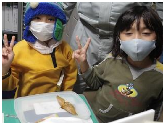
自分で採集したクスサンを前に記念撮影