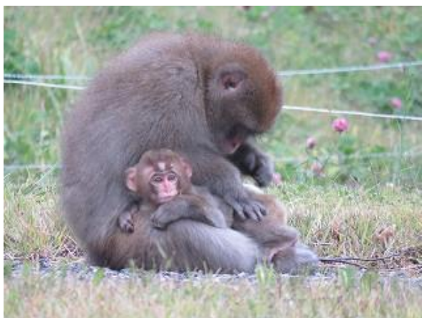
毛繕い中のニホンザル (10/6 撮影)