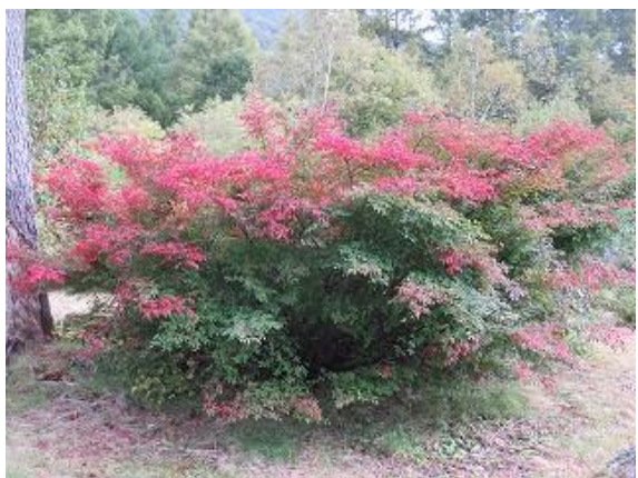
紅葉し始めたニシキギ