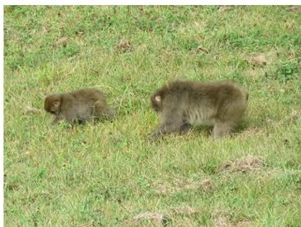
シロツメクサを捕食中のニホンザル (10/7 撮影)