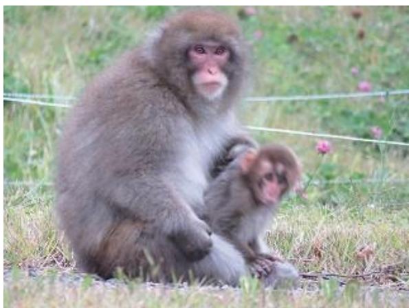
親子のニホンザル (10/6 撮影)

連日のように猪根平にニホンザルが出没しています。大半は食事に費やしていますが、毛繕いや日向ぼっこにも余念がありません。朝晩、夜中に「ホー」と遠吠えする声も聞こえています。繁殖の時期を迎えたことに関連する繁殖行動の一環でしょうか？カラマツに登り、樹上で遠吠えする雄のニホンザルを撮影しました。