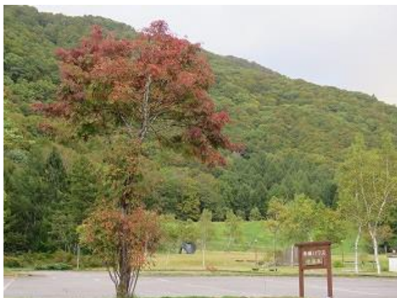
紅葉し始めたナナカマド (猪根平にて 10/6 撮影)