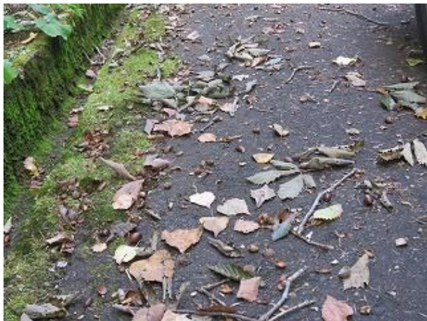
地面に落下・散乱したミズナラの殻斗と外果皮 (大多和峠にて 10/6 撮影)