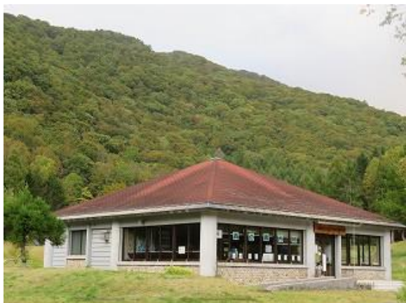
ビクターセンターより猪根山を眺望 (10/6 撮影)