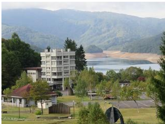
猪根平テニスコート広場よりビジターセンター、有 峰湖を眺望（10/7 撮影）