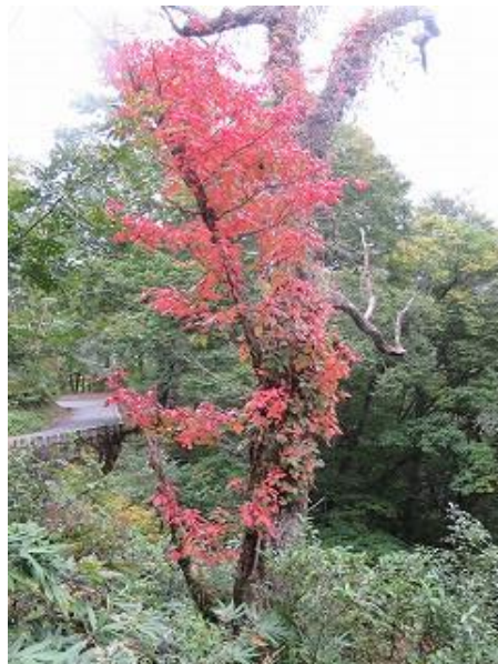
紅葉し始めたツタウルシ（大多和峠にて10/6 撮影）