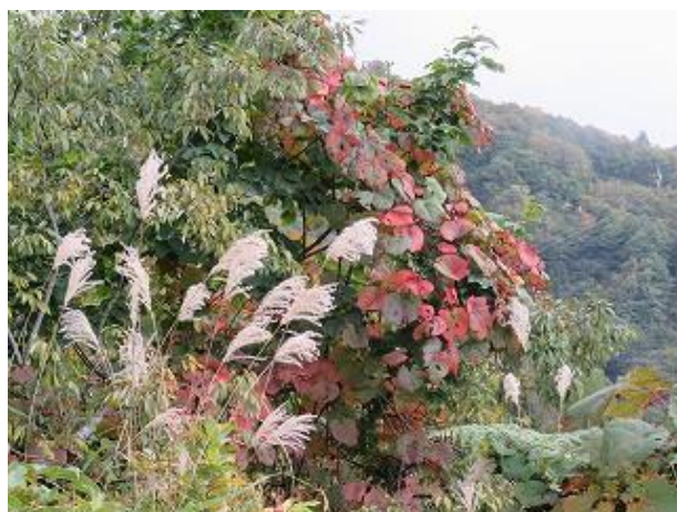
紅葉し始めたヤマブドウ（猪根平にて10/6 撮影）