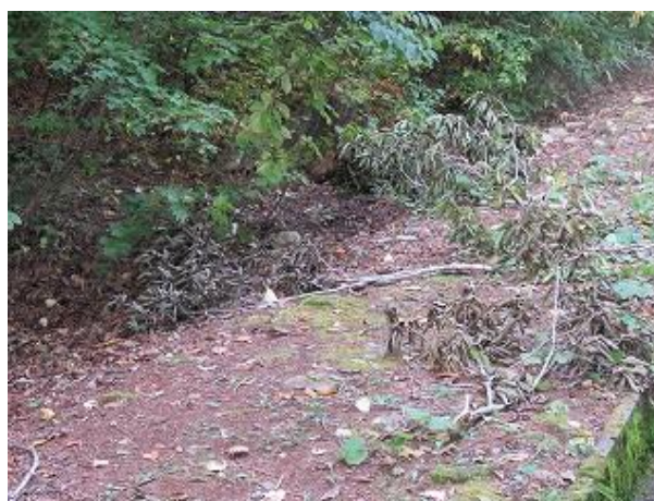
地面に落下したミズナラの枝 (大多和峠にて 10/6 撮影)