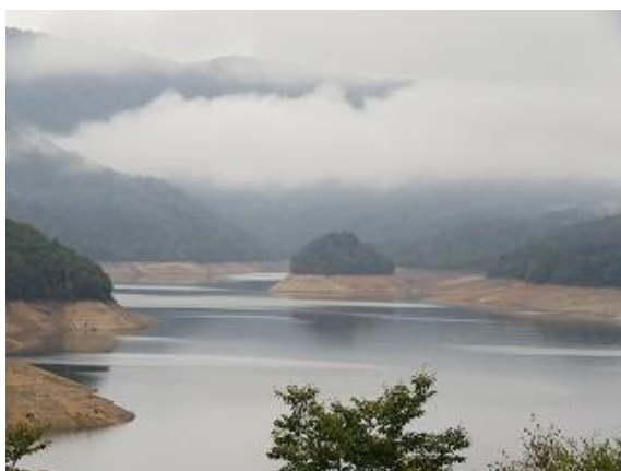
有峰湖展望園地より有峰湖と宝来島を眺望 （10/7 撮影）