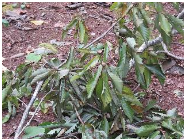
地面に落下したミズナラの枝 (大多和峠にて 10/6 撮影)

先週の東西半島に引続き、ツキノワグマのフィールドサイン、クマ棚を大多和峠でも発見しました。やはりクマ棚が作られ下の地面には殻斗（ドングリの帽子の部分）の付いたミズナラの枝や外果皮、ドングリが落ちていました。