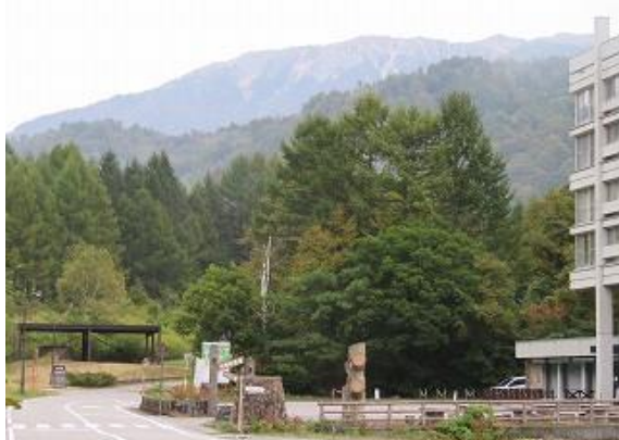
猪根平折立線より薬師岳を眺望（10/7 撮影）