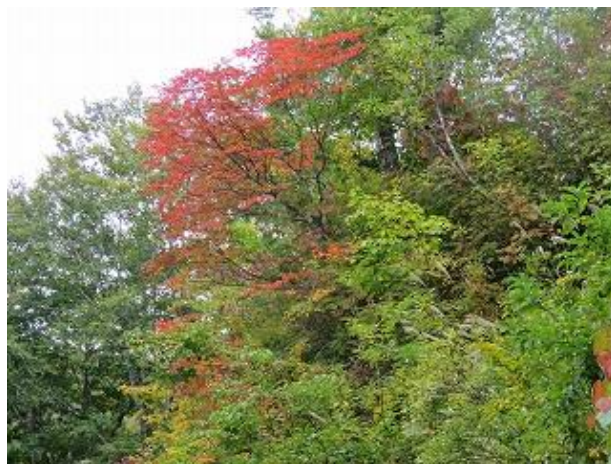
紅葉し始めたヤマウルシ（大多和峠にて10/6 撮影）