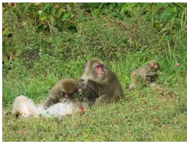
毛繕い中のニホンザル (10/7 撮影)