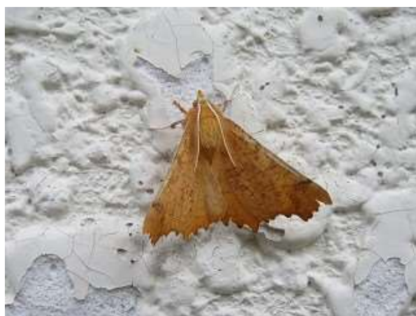
飛来したキリバエダシャク