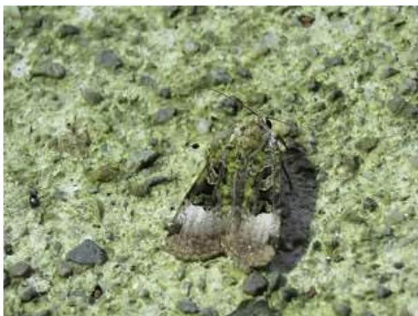
飛来したキシタミドリガ