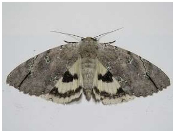
飛来したシロシタバ