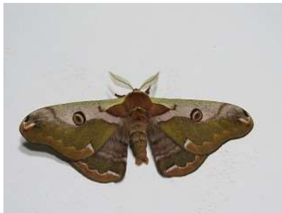
飛来したヒメヤママユ♂