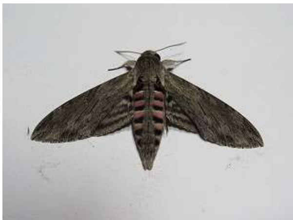
飛来したエビガラスズメ