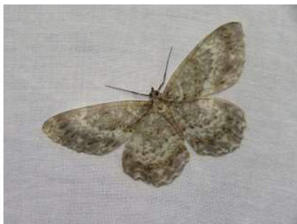
飛来したチャマダラエダシャク