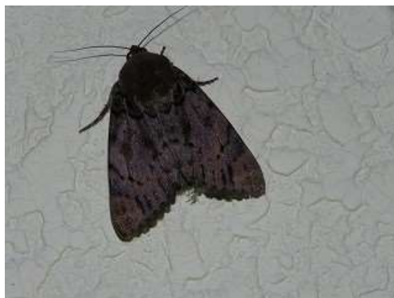
飛来したフクラスズメ