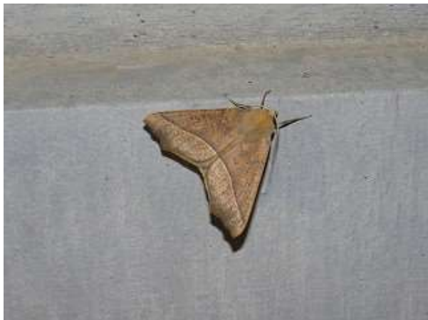
飛来したエグリヅマエダシャク