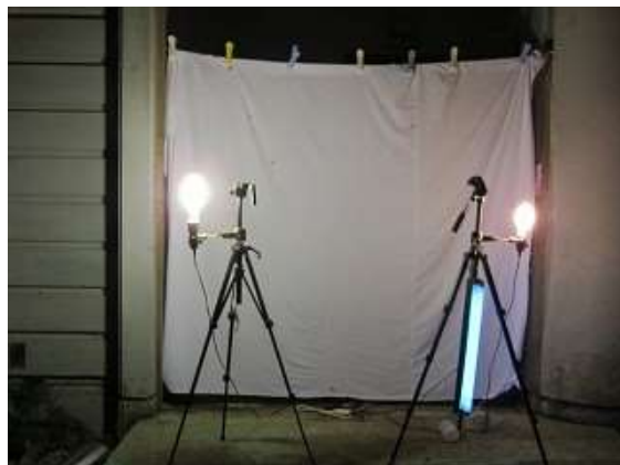
ライトオン直後のライトトラップの様子

19:00にライトオンして灯火採集を開始しました。表1にライトトラップに飛来した昆虫類を表示しました。ヒメヤママユ♀が最初に飛来しました。ヒメヤママユ♂は21:00~24:00に渡り飛来しました。ヒメヤママユの飛来時間帯を下図に示しました。クスサン♂は深夜1:00から明け方4:00にかけて飛来しました。ヤガ科シタバ亜科では、シロシタバとゴマシオキシタバが飛来しました。9月14日と比べ、飛来数は激減しました。スズメガ科では深夜エビガラスズメが飛来しました。シャクガ科ではキリバエダシャクとエグリツマエダシャクが飛来しました。蛾類以外の昆虫類では、ヒメバチ類(種未同定)やアキアカネが飛来しました。