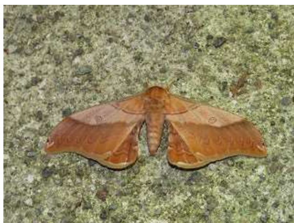
飛来したクスサン