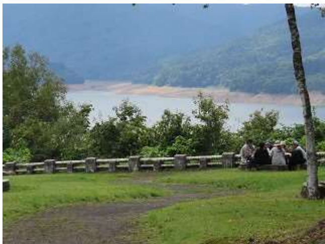
有峰湖展望園地で食事中の家族連れ（9/21 撮影）