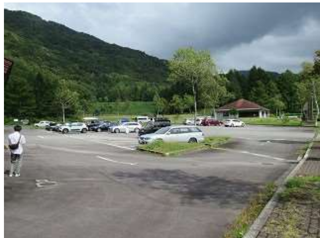
有峰ハウス前の駐車場での駐車風景（9/21撮影）