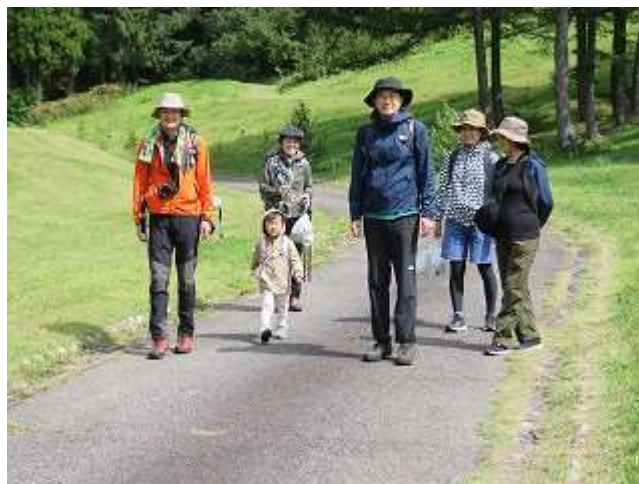
猪根山遊歩道散策から戻られた家族連れ（9/21撮影）

この4連休、有峰を訪れた方は、ご家族、ご友人、単独で、各々遊歩道散策、森林浴や冷タ谷キャンプ場での野営等を楽しまれました。