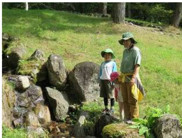
せせらぎ広場で生き物探し中の家族連れ（9/21撮影）