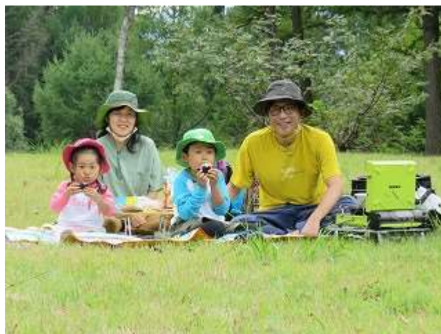
バーベキュー広場で昼食中の家族連れ（9/21撮影）