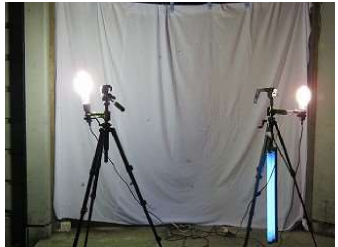
ライトトラップ開始時の様子