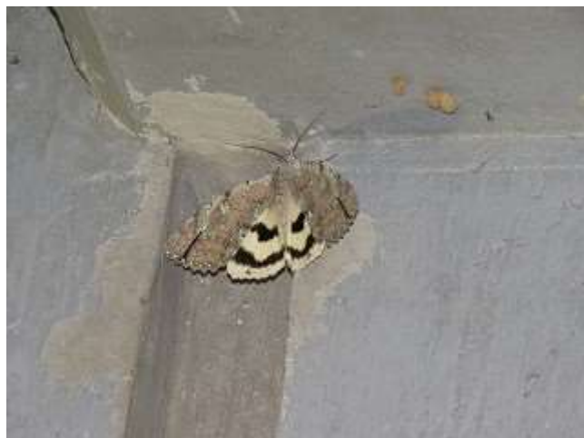
飛来したシロシタバ♂