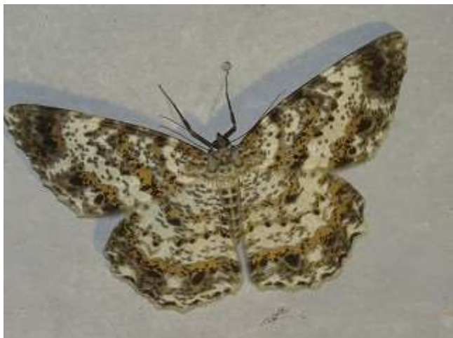
飛来したチャマダラエダシヤク♂