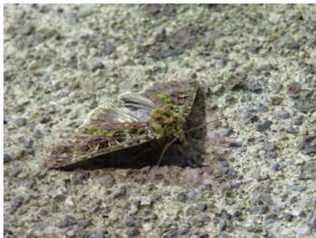
飛来したオオアオバヤガ♂