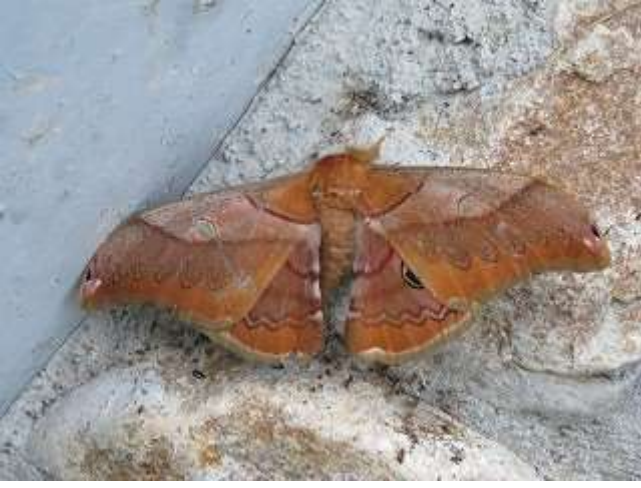
飛来したクスサン♂