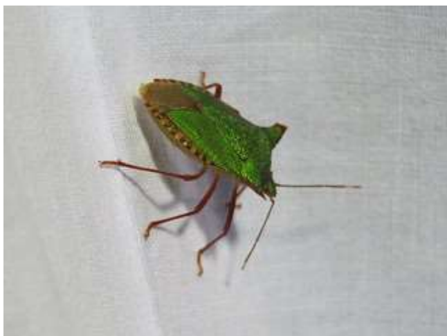
飛来したツノアオカメムシ