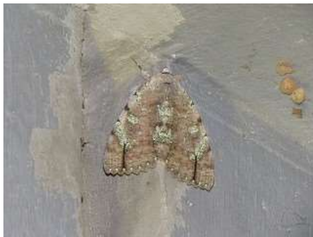
飛来したシロシタバ♂