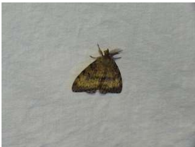
飛来したマイマイガ♂