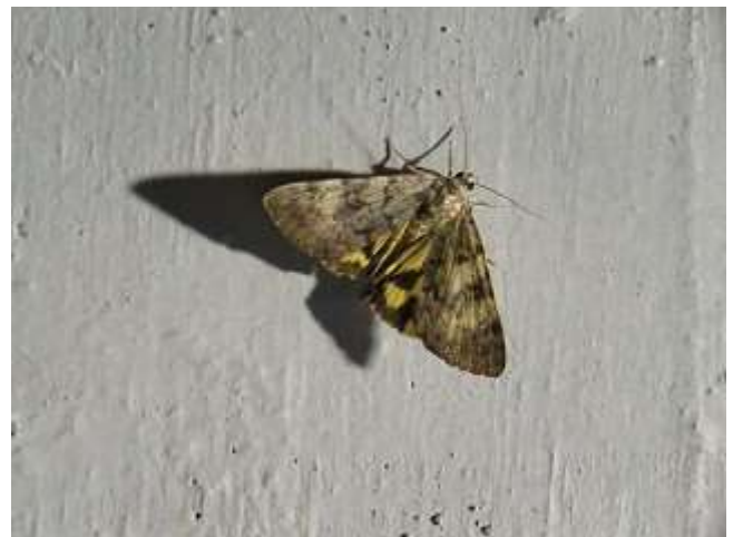
飛来したゴマシオキシタバ♂