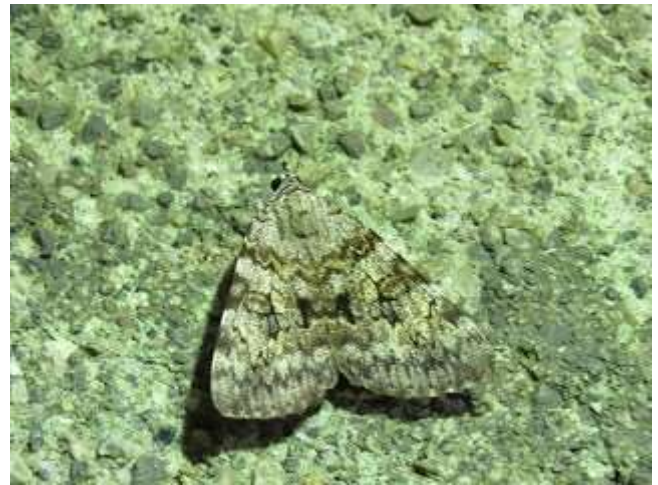
飛来したゴマシオキシタバ♂