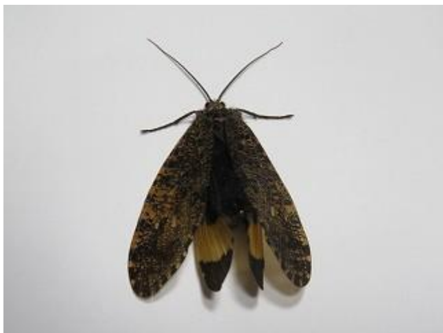
飛来したムラサキトビケラ