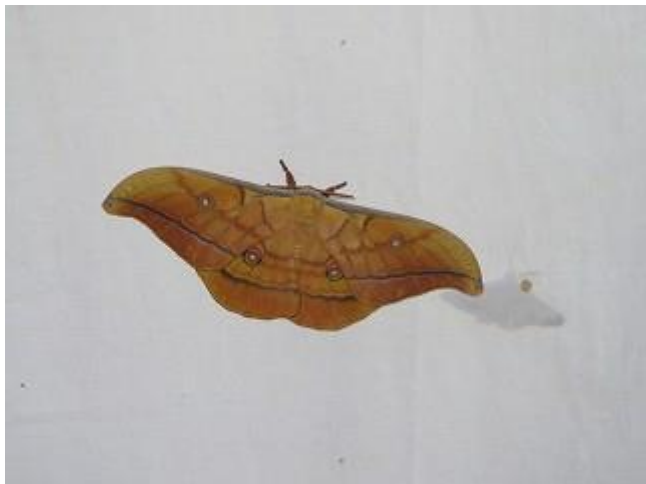
飛来したヤママユ♂