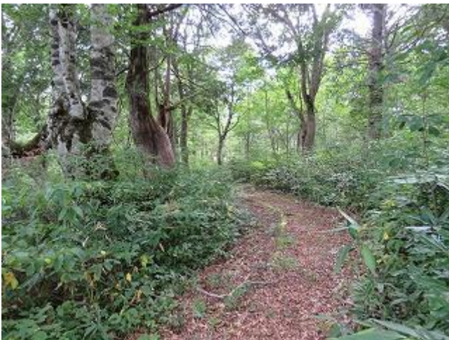
草刈り後の桐山散策路 桐山散策路にて 8/29 撮影