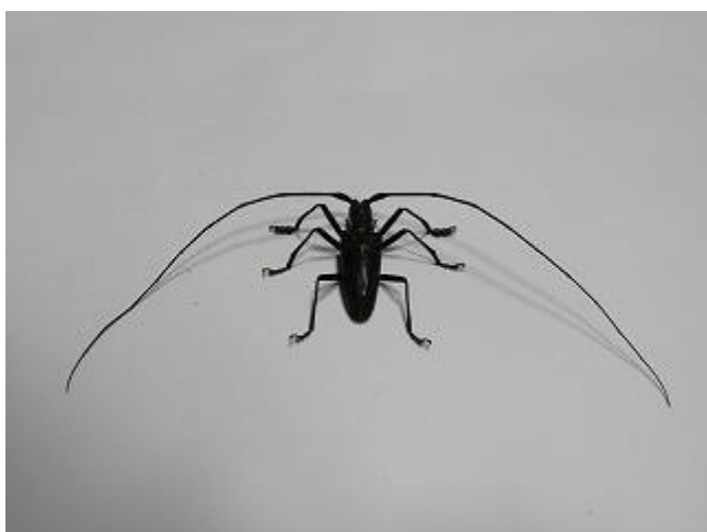
飛来したヒゲナガカミキリ♂