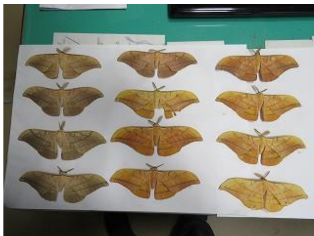
飛来したヤママユ♂の個体変異