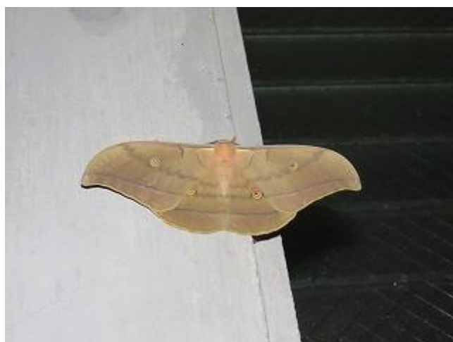
飛来したヤママユ♂