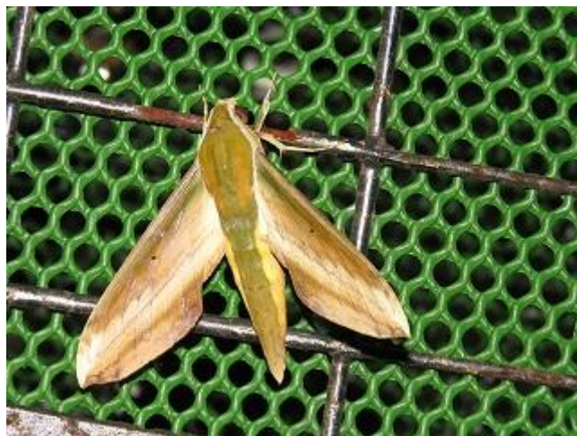
飛来したキイロスズメ♂