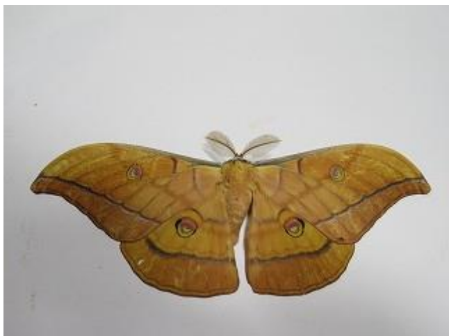
飛来したヤママユ♂