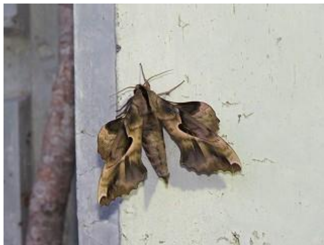
飛来したエゾスズメ♂