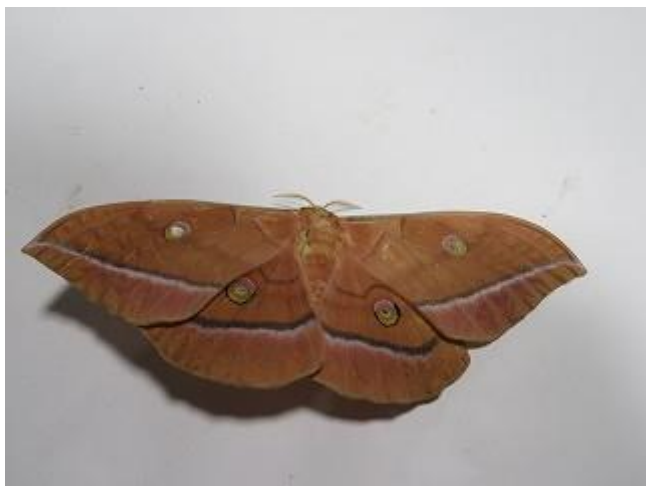
飛来したヤママユ♂