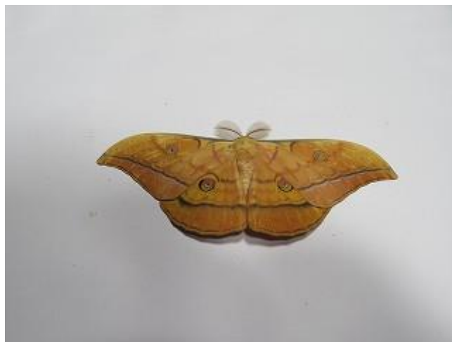
飛来したヤママユ♂