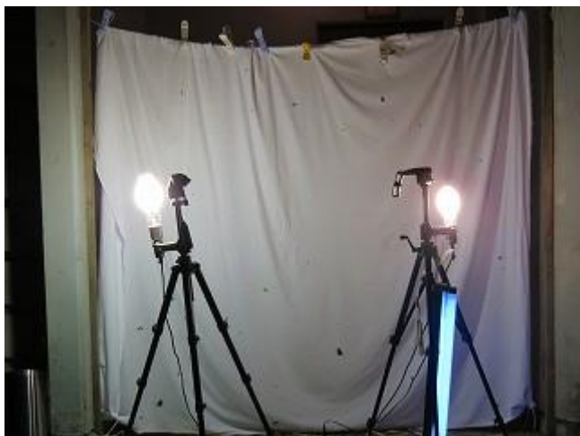
ライトオン直後のライトトラップの様子