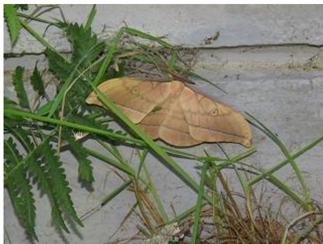
飛来したヤママユ♂