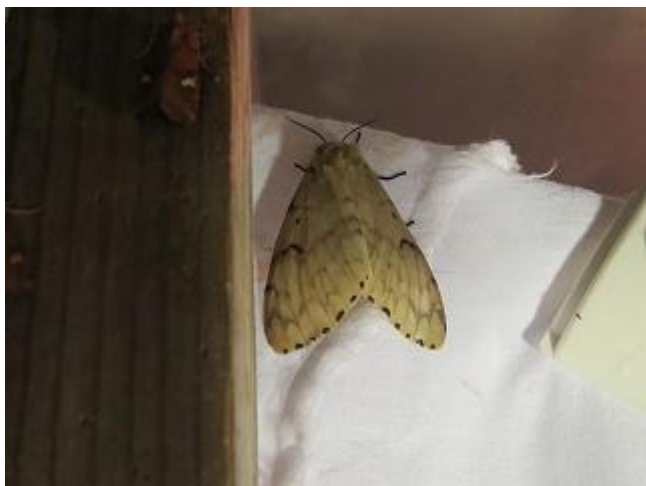
飛来したマイマイガ♀ (ビクターセンター裏にて8/17撮影)