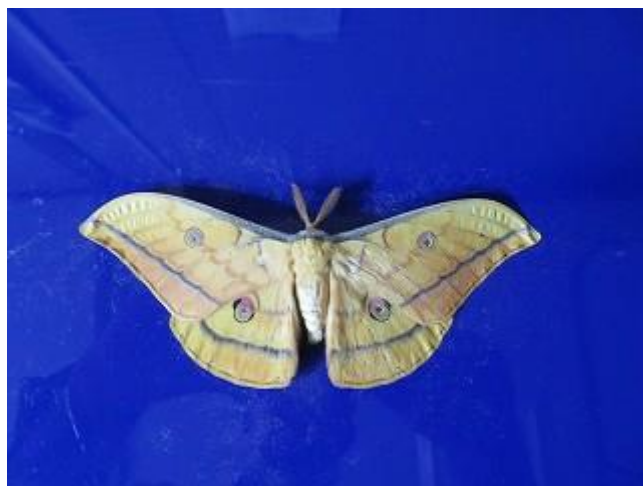
飛来したヤママユ♂ ビクターセンター裏にて8/18撮影)