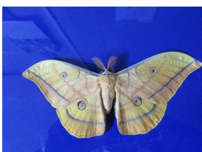
飛来したヤママユ♂ ビクターセンター裏にて8/18撮影)