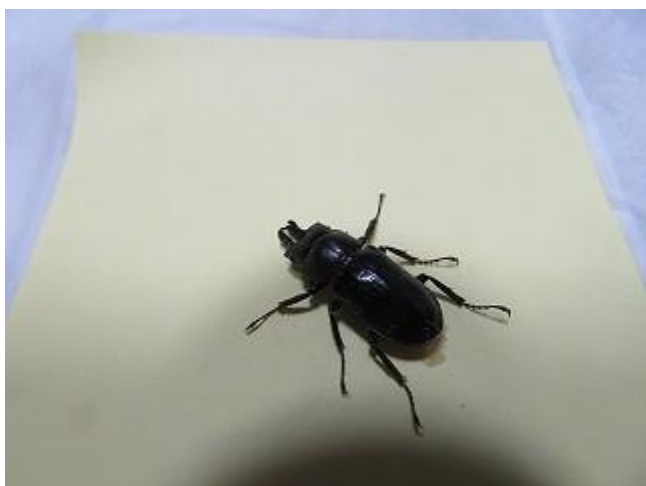
飛来したオニクワガタ♂ (ビクターセンター裏にて8/17撮影)