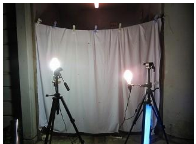
ライトオン直後のライトトラップの様子 (ビジターセンター裏にて8/17撮影)