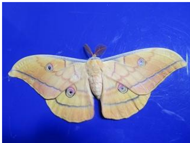
飛来したヤママユ♂ (ビクターセンター裏にて8/17撮影)