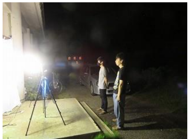
飛来した昆虫類を観察中の参加者 (ビジターセンター裏にて8/17撮影)