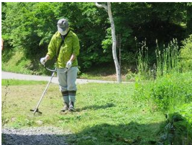
草刈り実施中の指導員（6/22 撮影）