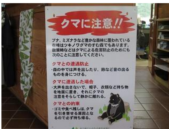
ビジターセンター内に常設された「クマに注意」の看板 (6/18 撮影)