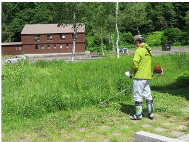
草刈り実施中の指導員（6/22 撮影）