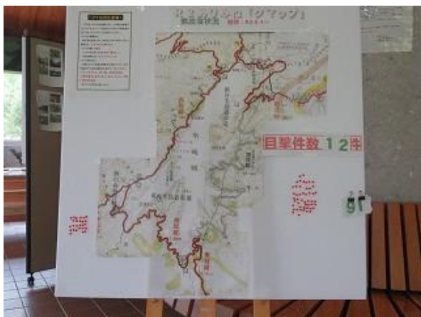
ビジターセンター内に設置されたありみね「クママップ」 (6/18 撮影)