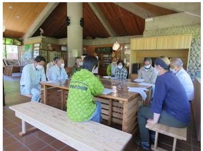
熊対策緊急会議の様子（ビジターセンター内にて撮影）

有峰地区では、次年度以降も適時に同様の「普及活動を中心とした対策」を継続していきたいと考えています。ただし、有峰地区は、ツキノワグマの恒常的静止区域であり、有峰森林文化村憲章の「2. 生き物が気ままに住める環境を守ります。」にも配慮していこうと考えています。