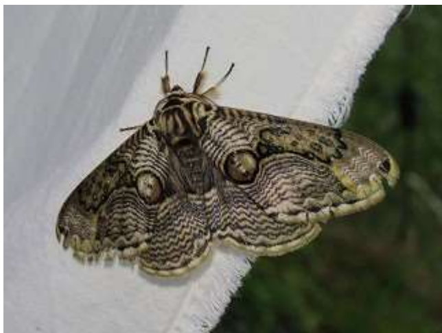
飛来したイボタガ♂