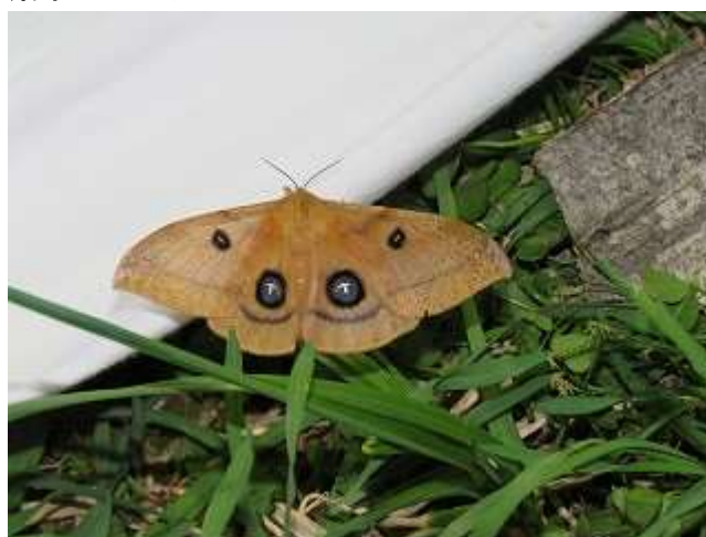
飛来したエゾヨツメ♀