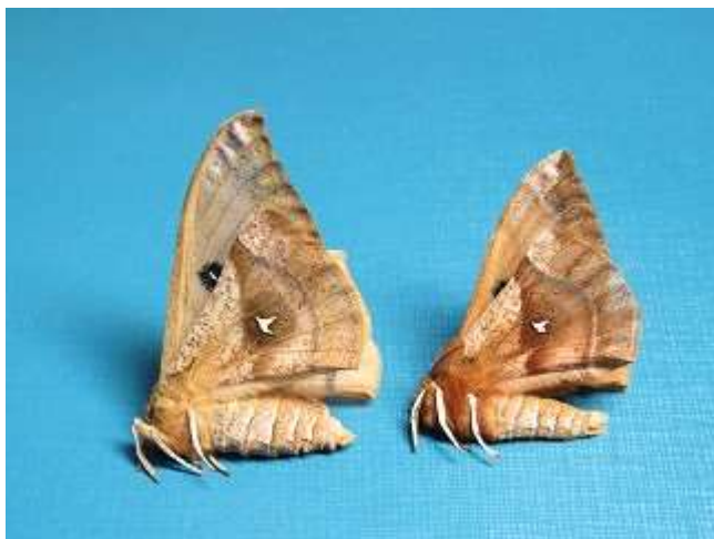
エゾヨツメ♀ (左) ♂ (右) の比較