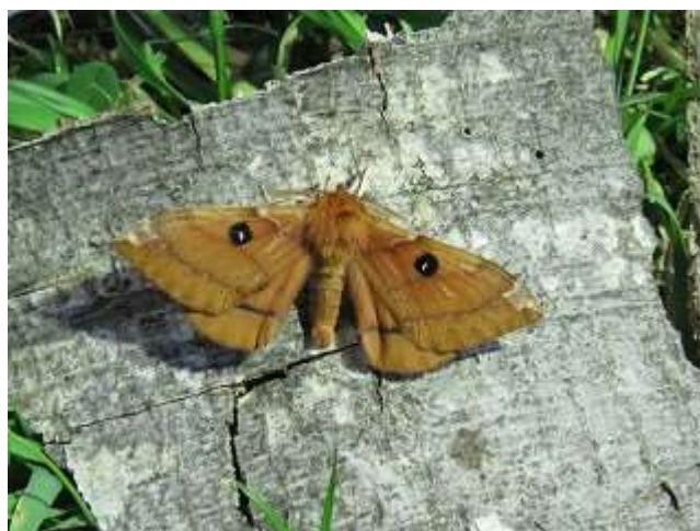
飛来したエゾヨツメ♂