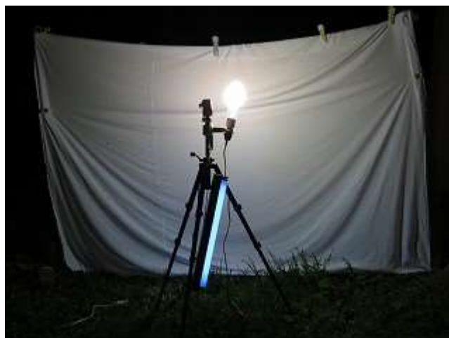
ライトトラップの様子