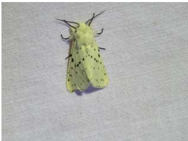
飛来したアカハラゴマダラヒトリ♀