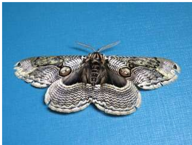
飛来したイボタガ♂