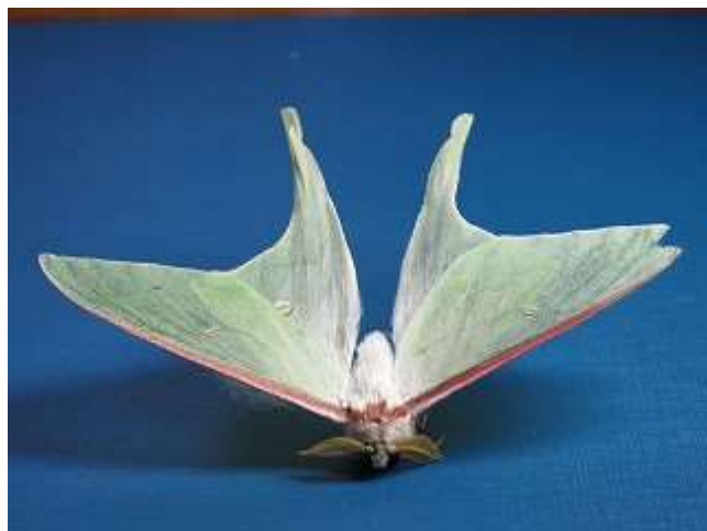
飛来したオナガミズアオ♂